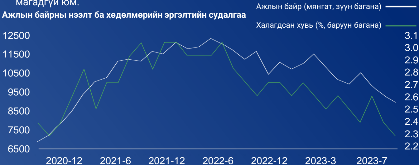
Ажлын байрны нээлт ба хөдөлмөрийн эргэлтийн судалгаа