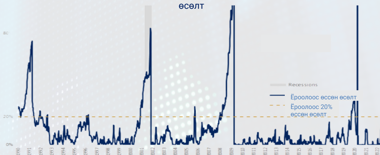
АНУ-ын ажилгүйдлийн тэтгэмж авсан хүмүүсийн өсөлт

Ажилгүйдлийн түвшин нь өнгөрснийг харуулсан хоцрогдолтой эдийн засгийн үзүүлэлт тул шинжээчид ажилгүйдлийн тэтгэмж авагчид болон төрийн ажилгүйдлийн даатгал авсан хүмүүсийн тоог илүү онцолж авч үздэг. Эдгээр үзүүлэлтүүд нь эдийн засгийн нөхцөл байдлыг ирээдүйд ямар байхыг тодорхойлсон илүү урьдчилж харсан байдаг. Ажилгүйдлийн тэтгэмж авагчдын тоо хэдий доогуур түвшинд байгаа ч 4 сараас хойш өсөх хандлагатай байгаа ба хамгийн доод хэмжээнээс одоогоор 20% өссөн үзүүлэлттэй байна. Эдийн засгийн уналттай үед компаниуд ашигт ажиллагаагаа хадгалахын тулд зарим ажилчдаа цөөлж цалингийн зардлаа танах үйлдэл хийж магадгүй.