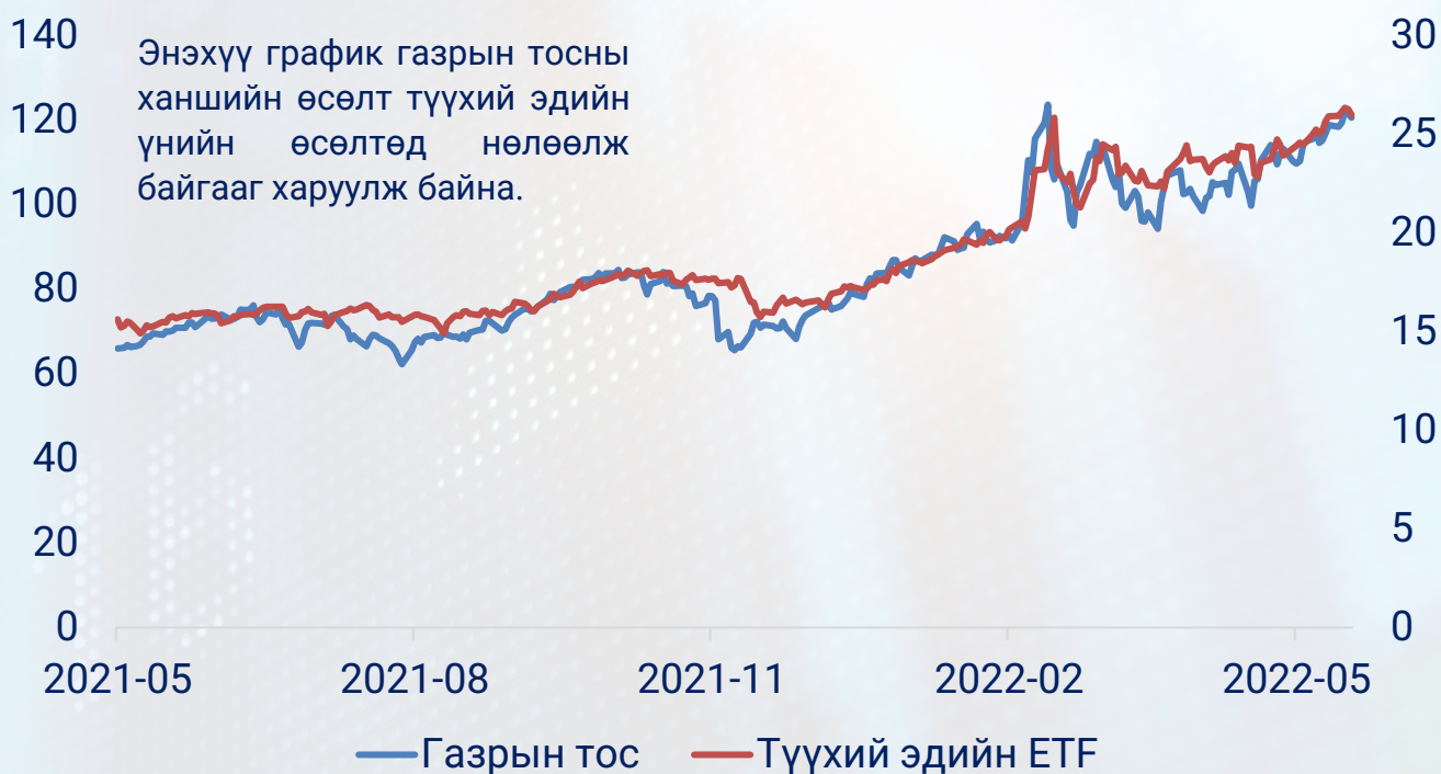
Газрын тос, түүхий эдийн ханш

ХНС бодлогын хүүг өсгөж хоол хүнсний эрэлтийг буулгах аргаар инфляцын өсөлтийг сааруулах гэж оролдож магадгүй боловч олон улсын түүхий эдийн ханшийн хөдөлгөөнд дорвитой нөлөөлж чадахгүй.