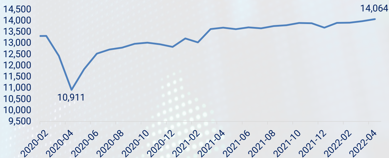
АНУ-ын бодит өрхийн худалдан авалт /тэрбум доллар/

Өнгөрсөн 4 сард өрхийн худалдан авалт сүүлийн 3 сар дундаас хамгийн хурдтай өссөн сар байсан нь ажлын байрны тоо нэмэгдэх болон өрхийн хадгаламж өссөнөөс улбаатай байв. Walmart, Target өөрсдийн борлуулалтын төсөөллөө бууруулсан ч Macy's, Nordstrom, Ralph Lauren компаниуд борлуулалтын төсөөллөө өсгөсөн нь эдийн засгийн нөхцөл байдал муугаар төсөөлж байснаас илүү сайн байж магадгүйг харуулсан. Худалдааны бизнесүүдийн хувьд борлуулалт болон эрэлт хангалттай өсөж байгаа ч цалин, тээврийн зардал өсөж байгаагаар холбоотойгоор цэвэр ашгийн хэмжээ буурч байна.