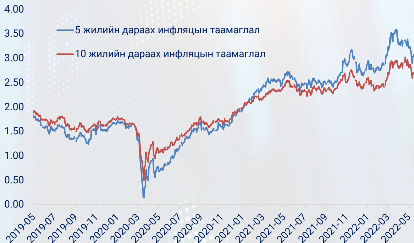
5 болон 10 жилийн дараах инфляцын таамаглал

40 жилд тохиогоогүй дээд инфляцын түвшин төв банкны хатуу мөнгөний бодлого баримтлахад хүргэсэн. Инфляц хэдий дээд түвшнээсээ бууж байгаа дүр зурагтай байгаа ч төв банкны зорилтот түвшин болох 2%-д хүрэхэд тодорхой хугацаа орох нь ойлгомжтой боллоо. Бондын зах зээлээс тооцсон 5 болон 10 жилийн хугацаатай инфляцын түвшний таамаглалууд буурч байгааг доорх зураг харуулж байна. Орон сууцны зээлийн хүү өсөж байгаа нь байрны худалдан авалтыг бууруулж, хэрэглээний эрэлт саарч, нийлүүлэлт хэвийн байдалд орсноор инфляцыг бууруулах боломжтой юм.