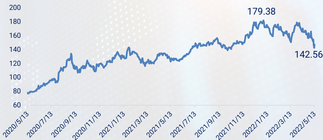
Apple-ийн хувьцааны ханш

Энэхүү уналтыг хэдий хүртэл үргэлжлэхийг хэлж мэдэхгүй боловч Apple компанийн хувьцааг өсөхөд нөлөөлөх хэд хэдэн хүчин зүйлс байна. Жишээлбэл компанийн олон улсад эзлэх гар утасны зах зээлийн байр суурь сайтай тул санхүүгийн хувьд эдийн засгийн хүндрэлийг даван туулахад хангалттай юм.