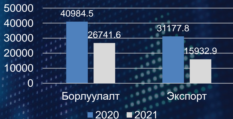
2020-2021 нүүрсний борлуулалт, экспорт /мянган тонноор/

2021 онд 15.9 сая тонн нүүрс экспортлосон нь өмнөх оны үеийнхээс 49 хувь буурсан байна.