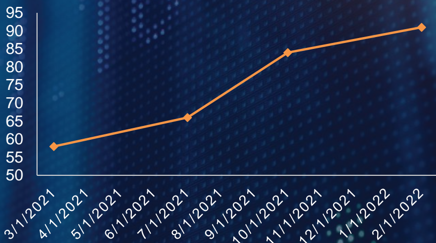
Зураг . Газрын тосны үнэ

Орос улс нь дэлхийн хамгийн том газрын тос үйлдвэрлэгч улсуудын нэг бөгөөд бүс нутгийн байгалийн хийн 40 орчим хувийг хангадаг. Орос Украин хоёр улсын таагүй харилцаа нефтийн үнийг өсгөсөөр байгаа бөгөөд WTI нефтийн үнэ 90 ам.долларт хүрснээр АНУ дэлхийн өөр томоохон газрын тос олборлогч Иран болон бусад томоохон газрын тос олборлогчдын эсрэг хориг арга хэмжээгээ цуцлах талаар хэлэлцэж байгаа нь өсөлтийг бага ч гэсэн удаашруулах хандлагатай байна.